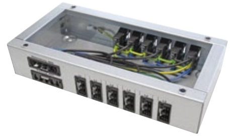
Abb. FUD 5.3.12/F

Intern komplett verdrahtet mit H07V-U 2,5 mm 2